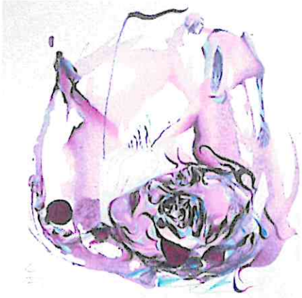
Deambulantes vacíos, 2024 Técnica Mixta/ 50 x 50 cm

La codificación de la naturaleza, el vaciamiento de sentido y la angustia que surge de ello.