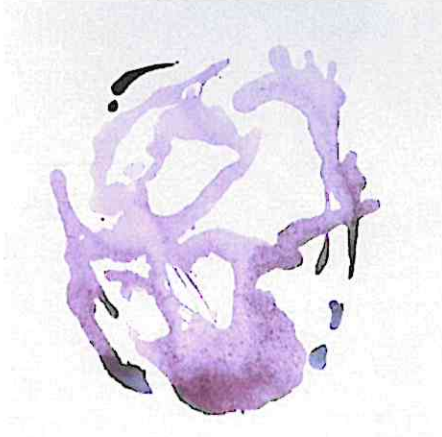
El Abrazo, 2024 Técnica Mixta 50 x 50 cm

La familia, lo tierno y el amor, algo que no se piensa, solo se siente.