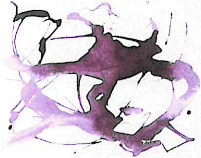
En el Instante, en el Umbral, 2024 Técnica Mixta 50 x 50 cm

"Más allá de entenderlo, lo sientes y es ahí donde al menos en un instante encuentras lo eterno."