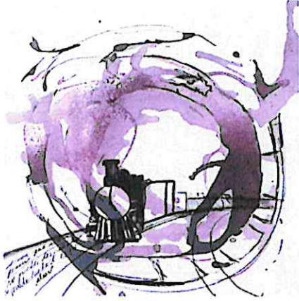
El Tren del Progreso, 2024 Técnica Mixta/ 50 x 50 cm

El tren que no para por nadie, mucho menos para el hombre contemporáneo. ¡No te lo vayas a perder!